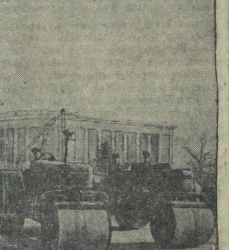
На снимке: асфальтировка проезжей части моста Элбакидзе.

Строительство моста Элбакидзе близится к концу. Сейчас вместе с мостостроителями здесь трудятся дорожники, работники городского транспорта. Вчера бригада каменщиков, руководимая П. Дигаевым, закончила облицовку верхней части речного пролета. Бригада выполнила свое производственное задание на 550 процентов, установив около 200 квадратных метров облицовочных плит. Закончено также устройство чугунных перил. Началась мойка и чистка мостового фасада. Вдоль тротуаров уложены широкие балясовые бордюры. Вслед за этим была произведена асфальтировка проезжей части моста. Быстро упрямившись с этой работой, дорожники приступили к асфальтированию подступов к мосту. Работники Трамвайно-троллейбусного управления, установив опоры для электрических лампов, готовятся к подвеске троллейбусной линии.