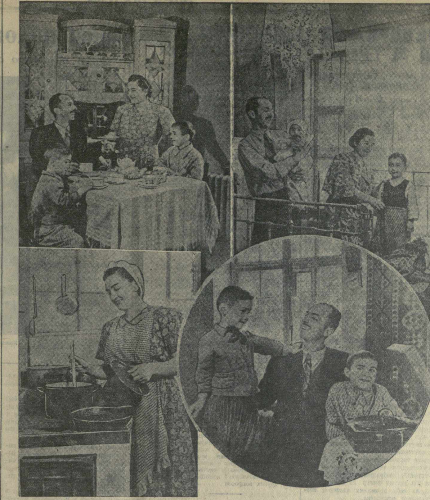
На снимках: В семье сталева Закавказского металлургического завода имени Сталина.