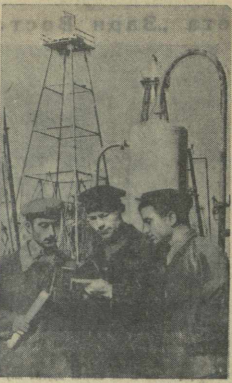
Азербайджанская ССР. Коллектив 3-го промысла первым в тресте «Кангачнефть» выполнил годовой план добычи нефти.

перушиного бравого содружества советских людей будущую гидроэлектростанцию решено было назвать «Дружба народов». Открыленные этой великой идеей, колхозники горячо занялись за осуществление своего решения. Инициатива колхозников сразу же нашла поддержку в партийных и советских органах всех трех республик. В районе озера Дрыоваты прибыли геологисты, топографы и гидротехники, которые в короткий срок провели изыскательные работы. В адрес стройки начали поступать тракторы и автомашины, цемент и железо. Был создан Совет содействия строительству. Сейчас участие в строительстве гидроэлектростанции принимают не только колхозы — инициаторы ее сооружения, но и другие сельхозартельи. Стройка стала народной. Скоро электроэнергия от гидроэлектростанции пойдет на все участки колхозного производства — на молотильню хлеба, на животноводческие фермы, в колхозные радиоузы, зерносушилки, кухни. Электромоторы будут приводить в движение зерноочистительные машины и колхозные мельницы. Ярким светом загорятся лампы электричества в сельских клубах, школах, в домах колхозников, на улицах колхозных сел. Красивым и величественным будет само здание электростанции. В его архитектуре символически запечатлется великая сталинская дружба народов, строящих коммунизм.