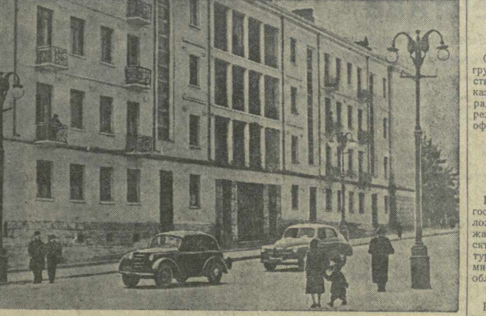
Кутанси. Жилой дом Шелкокомбината.

ЗЕСТАФОНИ. На Зестафонском заводе ферросплавов имени Л. П. Берия началась выслуга вознаграждений за выслугу лет. Металлурги получают свыше 1,5 миллиона рублей. Более 800 тысяч рублей получают рабочие плавильного, марганцевого цехов и цеха № 4.