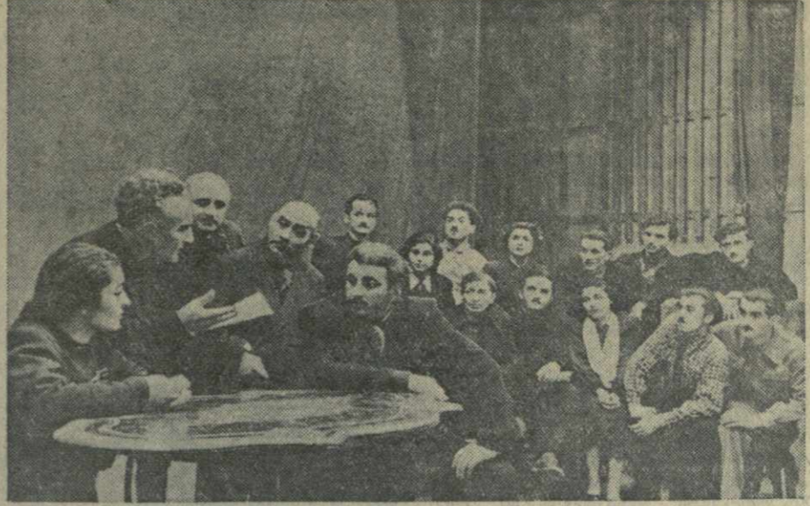
Драматический кружок — пьесы Г. Мдивани «Братья» и А. Сухова «Зеленая улица». Спектакли нашего кружка были продемонстрированы и на сценах других клубов. В главных ролях выступают передовые производственники завода.

— Одиннадцать кружков художественной самодеятельности занимаются в старейшем рабочем клубе паровозо-вагоноремонтного завода имени Сталина, — сообщил нам руководитель клубных кружков А. Мачабели. — Постановки драматических коллективов клуба всегда пользуются большим успехом. В этом году грузинский драматический кружок показал пьесу «Полотенные камни» И. Мосашвили, русский