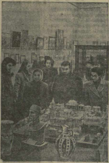
С большим интересом знакомится общественность Тбилиси с работами самодеятельных художников, представленными на республиканской выставке, открытой в Государственной картинной галерее Грузии. На снимке: в одном из залов выставки.