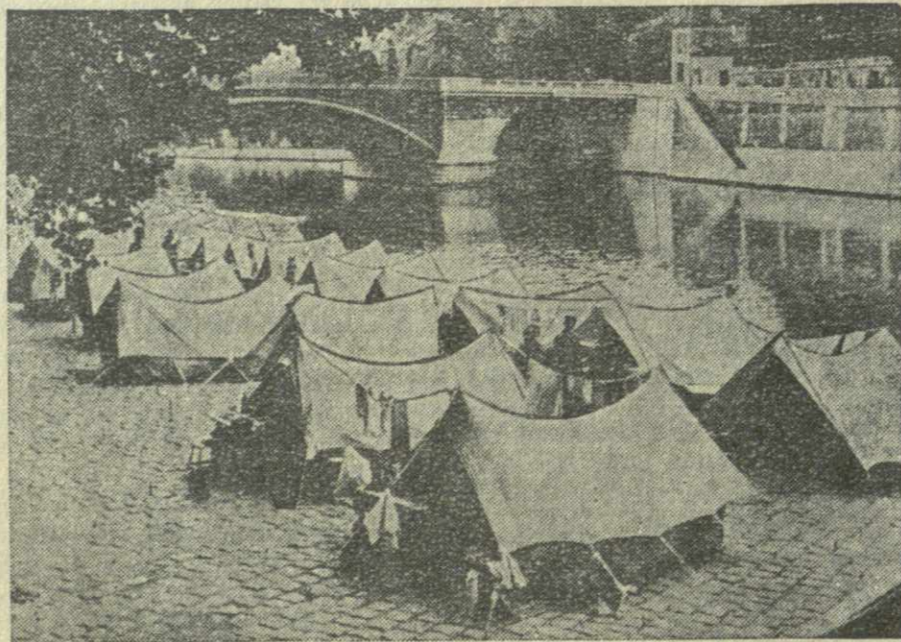
Французское фотоагентство Интерконтиненталь распространяет этот снимок под заголовком: «Жилищный кризис: поселок из палаток на набережной Сены». Агентство поясняет, что на снимке изображен поселок из палаток, раскинутых у хорошо знакомого парижанам моста Сюлли. 93 семьи рабочих с 240 детьми поселились в палатках на берегу Сены в Париже, так как не смогли найти другого жилья.

нин и Хрущев Советский Союз — это великая держава, и поддержка, которую оказали его руководители решению народа Кашмира, имеет очень большое значение. Бахши подчеркнул, что присоединение Кашмира к Индии является окончательным и народ не потерпит никакой попытки вновь поднять вопрос о будущем штата. Премьер-министр Кашмира сказал, что штат переживает сейчас период экономического подъема, и по второму пятилетнему плану на развитие экономики штата будет израсходовано 510 млн. рупий.