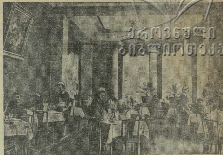
На снимке: кафе «Тбилиси», открытое недавно во вновь оборудованном помещении.