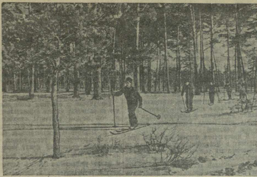
Алтайский край. Тысячи трудящихся ежегодно отдыхают в санаториях и домах отдыха, расположенных в живописных уголках края. Сейчас в санаториях и домах отдыха — зимний сезон.