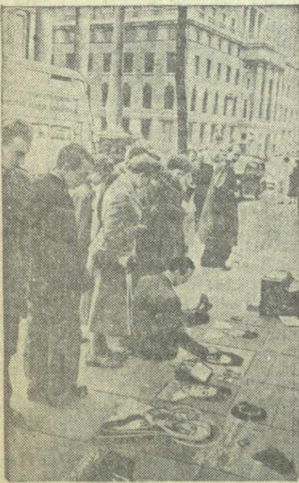
Англия. Уличный художник в Лондоне.

Вчера губернатор Кипра Хардинг распорядился закрыть греческую гимназию в городе Лимасол. Как указывает агентство Рейтер, данная мера предпринята в связи с тем, что учащиеся гимназии неоднократно активно выступали за присоединение Кипра к Греции.