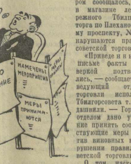
Рис. И. ГУРРО.

В редакцию поступило письмо, в котором сообщалось, что в магазине левобережного Тбилисшестора по Шахановскому проспекту, № 97, нарушаются правила советской торговли.