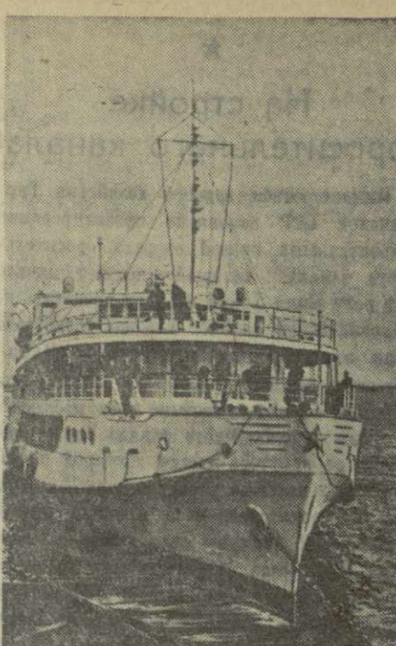
Якутск. Неланно из Ленинграда в числе других речных судов сюда прибыл своим ходом через Северный морской путь пассажирский теплоход «Искра-Куль». Новый теплоход вышел на линию Якутск—Таски—Якутск.