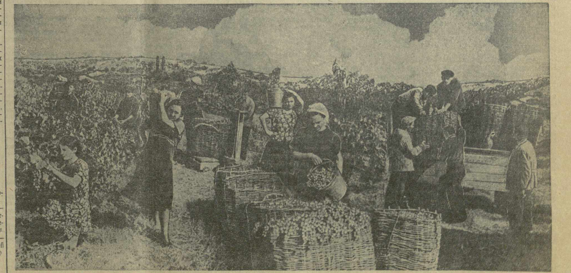
Богатый урожай собирают в этом году виноградары Горького района. Из колхозов на приемный пункт непрерывным потоком движутся машины и арбы, нагруженные виноградом. Агтеский завод шампанских вин уже принял более 500 тонн винограда при плане в 530 тонн. Колхоз имени Сталина селения Агени сдал более 60 тонн. На снимке: сбор винограда в колхозе имени Сталина селения Агени Горького района.

Многие десятки тонн фруктов отправляет ежедневно республиканская контора Грузконсервтреста в различные города страны. Более 3.000 тонн яблок, персиков, груш и других плодов уже отгружено в Москву, Ленинград, Уфу, Новосибирск, Сочи. Большое количество плодов отгружается также в класс Грузотрга на Всесоюзной сельскохозяйственной выставке для продажи ее посетителям. К праздничным дням из Абхазии и Аджарии будет отправлено много цитрусовых плодов в Москву и Ленинград. В ближайшие дни отгружается первая партия мандаринов.