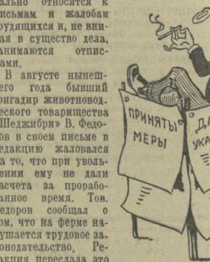
Рис. И. ГУРРО.

Однако некоторые работники еще формально относятся к письмам и жалобам трудящихся и, не вникая в существо дела, занимаются отписками.