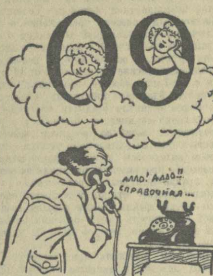
Рис. И. ГУРРО.

Пока я безуспешно пыталась выяснить через АТС телефон справочной вокзала, поезд пришел на станцию Тбилиси, и мне не удалось встретить свою мать.