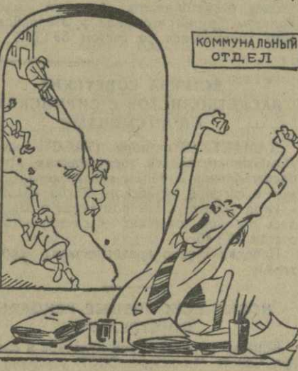
Рис. И. ГУРРО.

тельстве лестницы, связывающей улицу с переулком.