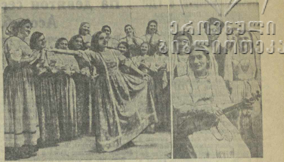
На снимках: выступление кружка русской песни и пляски железнодорожного района (слева) и самодеятельного ансамбля станкостроительного завода имени Ленина г. Тбилиси.