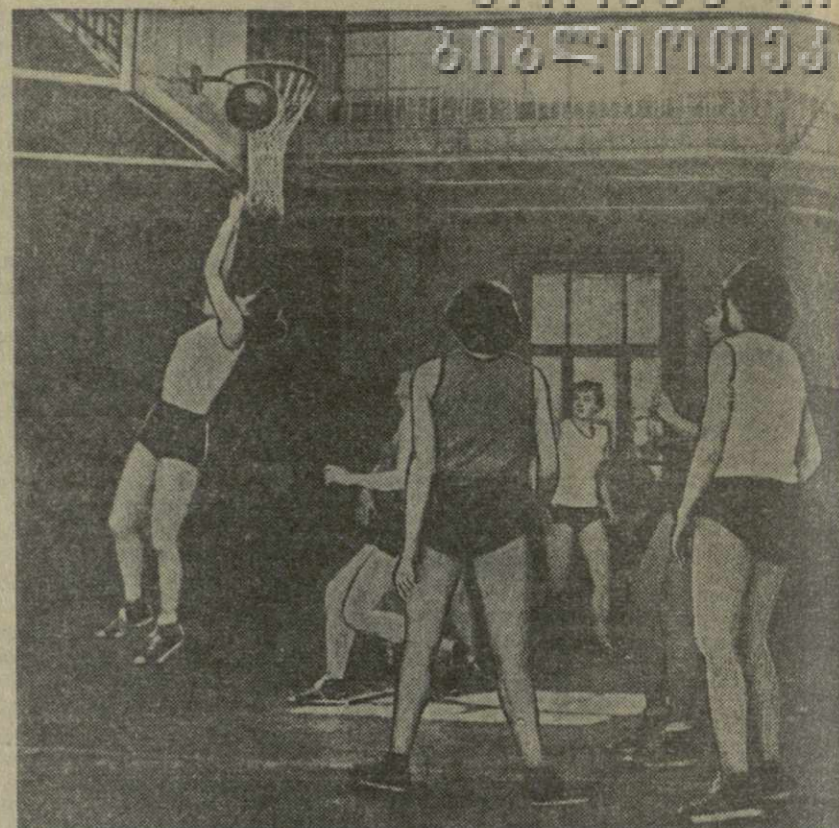
В Тбилиси находятся мужские и женские сборные команды баскетболистов Чехословацкой Республики.

Приезд чехословацких спортсменов в Тбилиси вызывает большой спортивный интерес. Сборные женские и мужские команды Чехословакии являются одними из постоянных претендентов на звание чемпиона Европы.