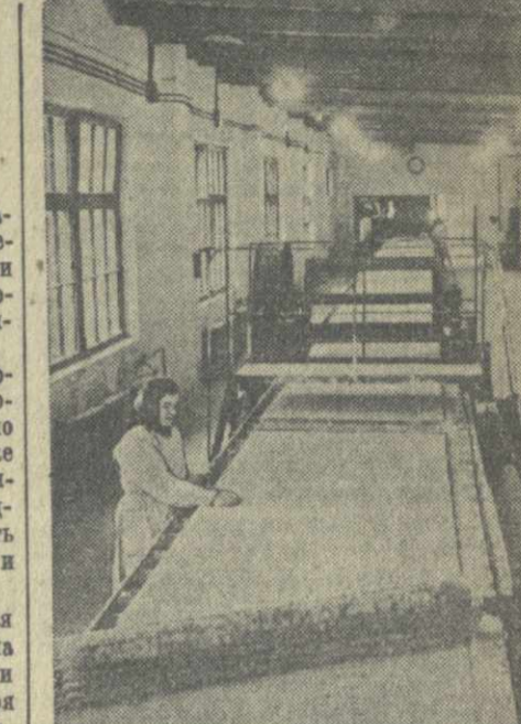
Украинская ССР. В Харькове вступил в строй действующих предприятий завод по производству сухой штукатурки. Предприятие оснащено новейшим отечественным оборудованием. Весь производственный цикл, начиная от подачи сырья и кончая транспортировкой изделий в склад готовой продукции, механизирован и автоматизирован. Проектная мощность нового завода 750 тысяч квадратных метров сухой штукатурки в год. На снимке: главный конвейер завода сухой штукатурки.

Вечернее заседание посвящено обсуждению докладов. (ТАСС).