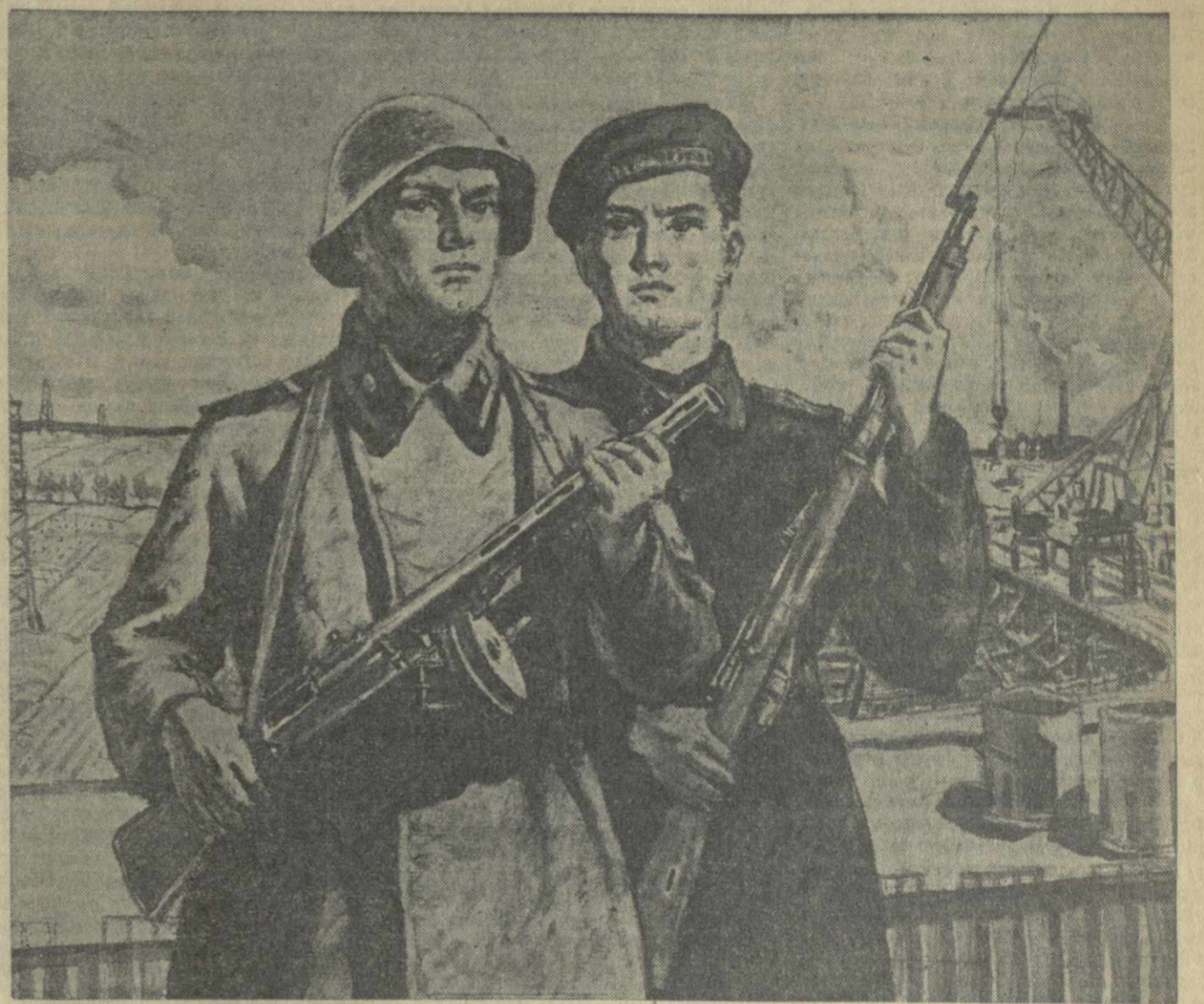
«НА СТРАЖЕ МИРА», Рисунок художника Р. Стурца.

Советская Армия и Военно-Морской Флот, как и весь народ, тесно сплочены вокруг Коммунистической партии и Советского правительства, несут боевую вахту, стоят на страже мирного созидательного труда нашей страны, идущей к торжеству коммунизма.