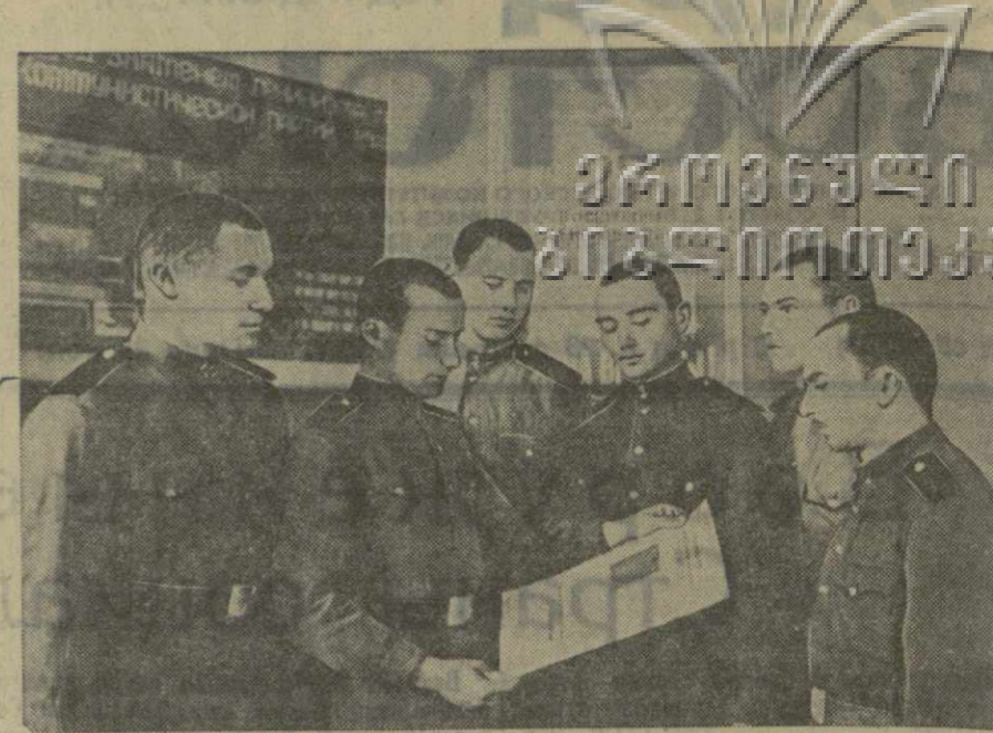
Воины-артиллеристы Н-ского подразделения ЗаКВО знакомятся с биографией кандидата в депутаты Верховного Совета Грузинской ССР, Фото Е. Баршах.

Сознавая свою величайшую ответственность перед народом, наши славные Вооруженные Силы твердо стоят на страже социалистической Родины, оберегая, как зеницу ока, мирный труд советских людей.