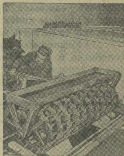
Курганский завод «Уралсельмаш» выпускает различные сельскохозяйственные орудия, применяемые при обработке почвы по методу Т. С. Мальцева.

С. ПОРТНОЙ. (Спец. корр. «Заря Востока»). Лагодехский район.