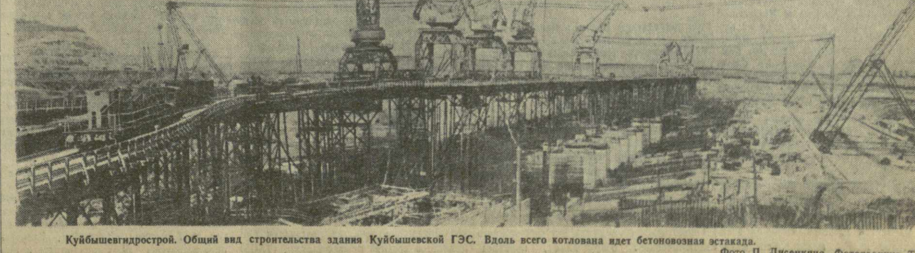
Куйбышевгидрострой. Общий вид строительства здания Куйбышевской ГЭС. Вдоль всего котлована идет бетоновозная эстакада.

Продолжаются земляные работы. Все больший размах приобретает строительство обходного судоходного канала. Его русло проходит по лесистому зеленому острову. Здесь уже давно вырублены деревья и кустарники, выкорчеваны пни. Грунт из канала вынимают экскаваторы, скреперы и земснаряды.