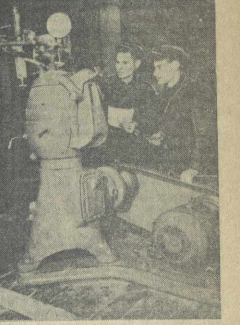
Тулеская область. Плавский завод «Смичка» основал выпуск высокопроизводительных сепараторов «ОСП» мощностью три тысячи литров молока в час.