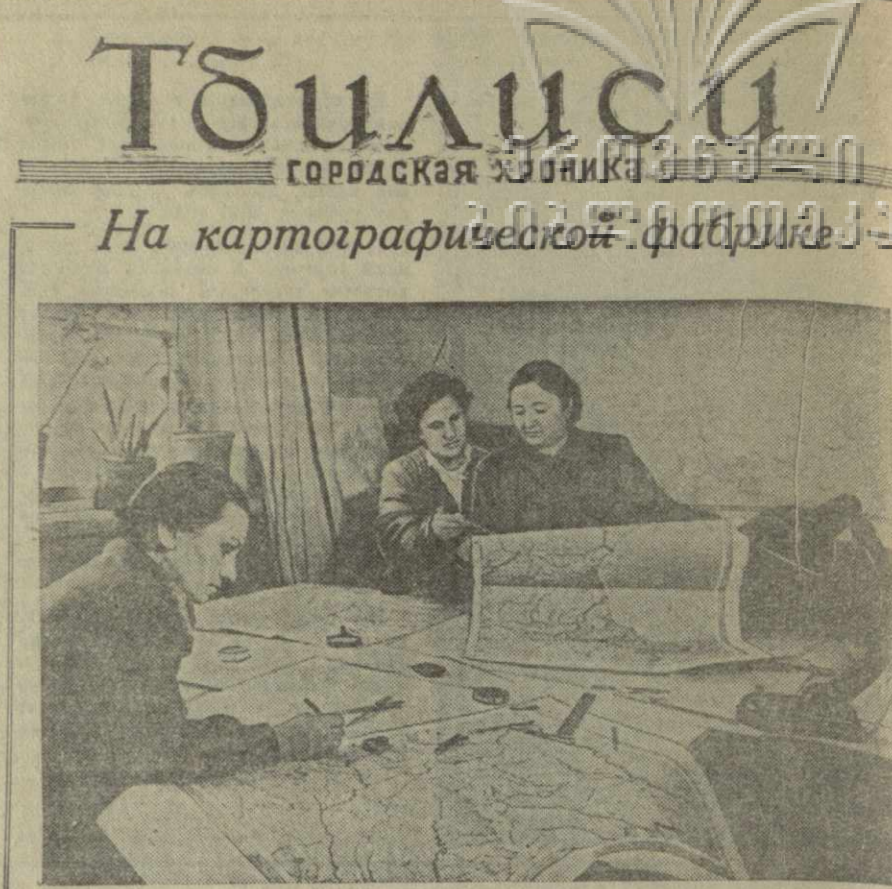
В школах, учебных заведениях, культурно-просветительных учреждениях — всюду можно видеть издания Тбилисской картографической фабрики № 8. Фабрика за последние годы издала много учебных и административных карт.

Как видно из сообщения агентства Рейтер, на сегодняшнем заседании парламентской фракции лейбористской партии не было принято никакой рекомендации национальному исполнительному комитету партии. Однако, как указывает агентство, исполком теперь, вероятно, поставит вопрос об исключении Бивена из партии.