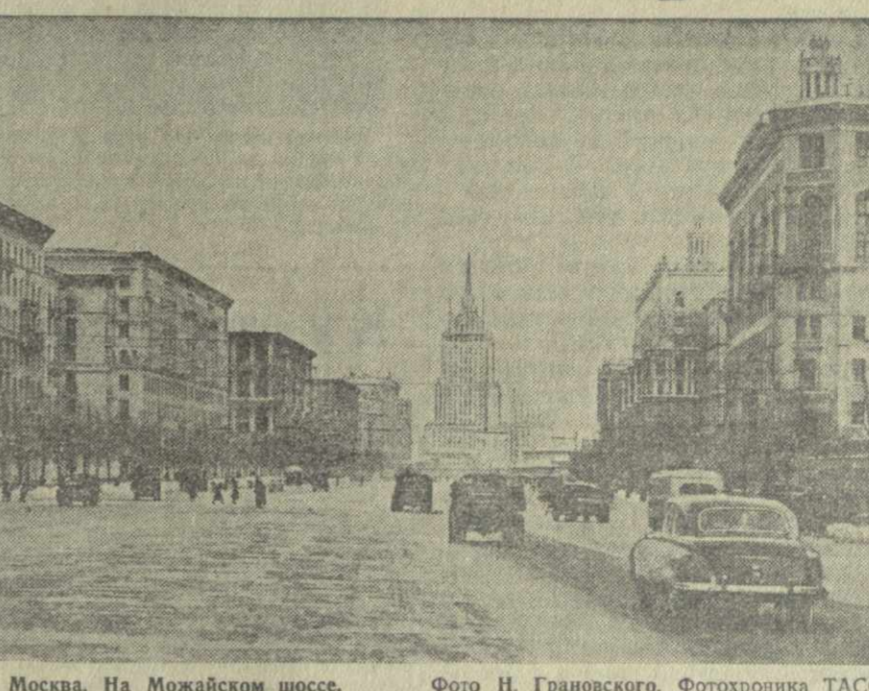
Москва. На Можайском шоссе.

В нынешнем году колхозные кассы взаимопомощи Кубани пошлют только в санатории 2.500 колхозников — на тысячу человек больше, чем в прошлом году.