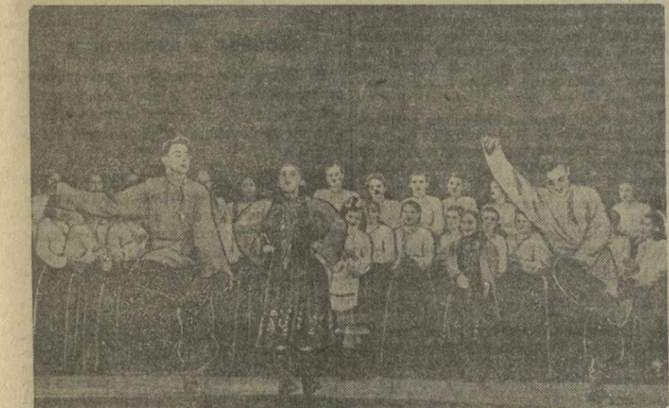
Хореографическая группа ансамбля песни и пляски прядильно-трикотажного комбината исполняет танец «Русская сюита».

В программу смотра были включены также сюжетные массовые танцы. Примером может служить «Русская сюита», показанная танцевальным коллективом прядильно-трикотажного комбината (хореограф т. Яценко), шуточная пляска «Солдаты на отдыхе» в исполнении рабочих строительного № 2 Тбилисстрой и другие.