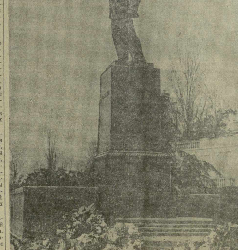
Памятник Владимиру Ильичу Ленину в Батуми.

В 8 часов вечера в Батумском государственном театре состоялось общегородское торжественное собрание, посвященное 85-летию со дня рождения В. И. Ленина.