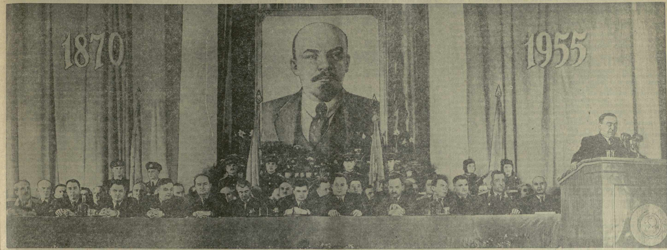
Торжественное заседание в Тбилиском государственном театре оперы и балета имени З. Палиашвили, посвященное 85-й годовщине со дня рождения В. И. Ленина. На снимке: президиум заседания. На трибуне — первый секретарь ЦК КП Грузии тов. В. П. Мжаванадзе.

№ 96 (9288) Суббота, 23 апреля 1955 г. Цена 20 коп.