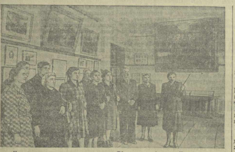
На снимке: в одном из залов Тбилисского филиала Центрального музея В. И. Ленина.