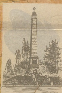
Орджоникидзе. Обелиск на братской могиле 17000 бойцов и командиров Красной Армии, погибших от рук денкинских галовей в 1919 году.