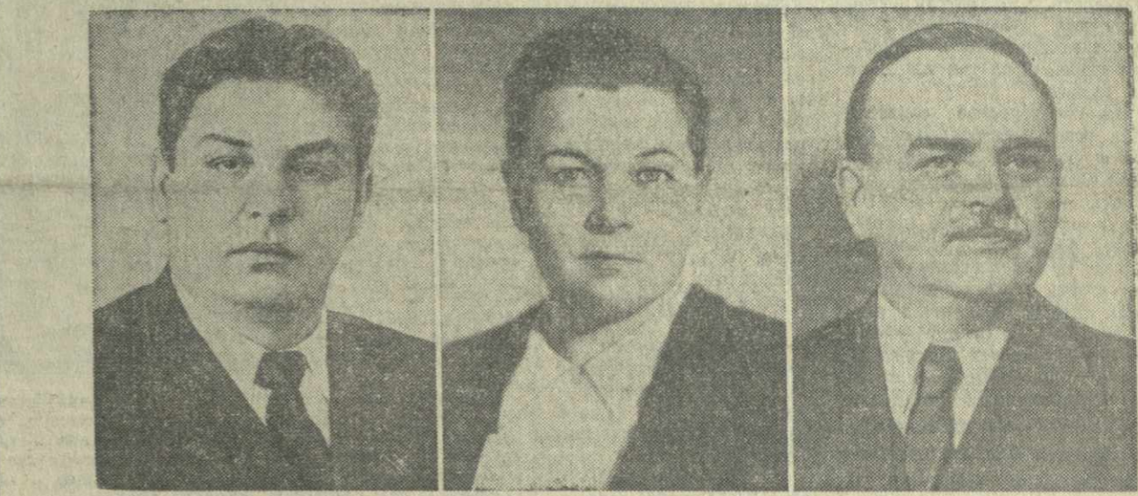
Д. Т. Шепилов, Е. А. Фурцева, Н. М. Шверник.