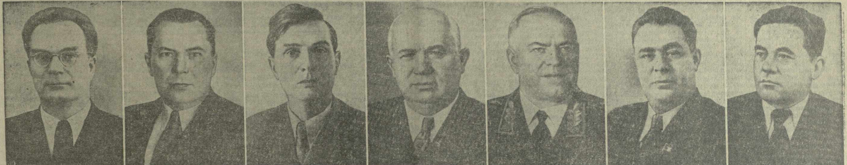
М. Г. Первухин, М. З. Сабуров, М. А. Суслев, Н. С. Хрущев, Г. К. Жуков, Л. И. Брежнев, Н. А. Мухитдинов.