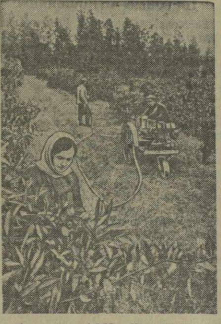
Аджарская АССР. На citrusовых плантациях идут весенние работы — перекопка почвы, внесение удобрений, опрыскивание деревьев. В Махвилаурском совхозе начато опрыскивание мандариновых деревьев против сельскохозяйственных вредителей.

Советское Правительство надеется, что, несмотря на возникающие в силу известных причин препятствия, отношения между Советским Союзом и Федеральной Республикой Германии, включая широкие торговые, а также культурные связи, будут благоприятно развиваться, ибо это в интересах обеих стран, в интересах укрепления мира в Европе.