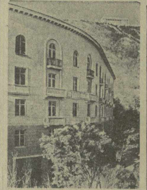
Тбилиси сегодня. Новый жилой дом на улице Чонкадзе.