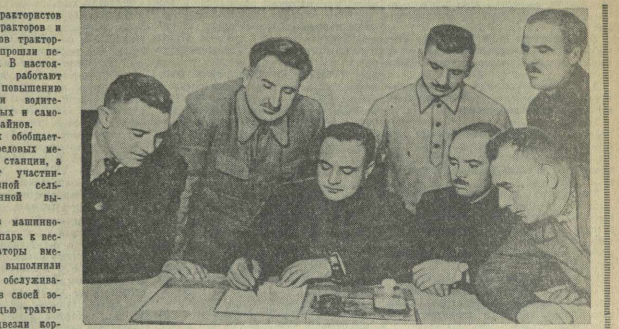
На снимке: члены делегации механизаторов Медведовской МТС и работники Цительской МТС подписывают в Цители Цкаро договор о социалистическом соревновании.

В МТС созданы бригады по механизации трудоемких работ в животноводстве. Силами этих бригад на фермах одного из колхозов установлены ветродвигатели.