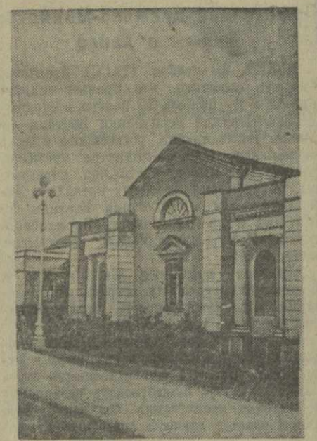
На снимке: ванное здание минеральных источников курорта Мендзия.