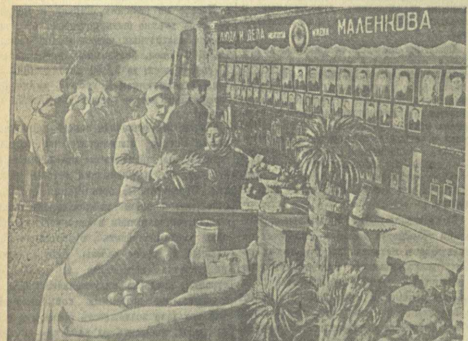
Районная сельскохозяйственная выставка в Лагодехи. На снимке: стенд колхоза имени Маленкова.