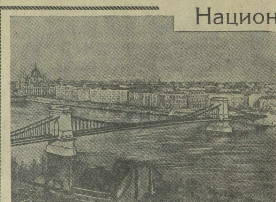
11 лет назад, 4 апреля 1945 г., героическая Советская Армия завершила освобождение Венгрии от гитлеровских оккупантов. Этот день положило начало новой эпохе в истории венгерского народа, стал его национальным праздником.

Адрес редакции и издательства: Тбилиси, пр. Руставели, 42. Телефоны: заместители редактора—3-18-04, 3-18-07, ответственный секретарь—3-17-06, приемная—3-11-24; ОТДЕЛЫ: партийной жизни—3-14-82, пропаганды марксистско-ленинской теории—3-11-22, советского строительства, обзоров печати—3-30-61, литературы и искусства—3-63-28, культуры—3-11-22, промышленности, транспорта и товароборота—3-22-82, сельского хозяйства—3-19-49, республиканской информации—3-17-03, писем—3-12-83, местных корреспондентов—3-16-27, иностранных—3-17-44. Издательство—3-22-63. Прием объявлений—3-18-02. Бухгалтерия—3-64-42. Директор типографии—3-24-50. Техническая часть—3-11-23.