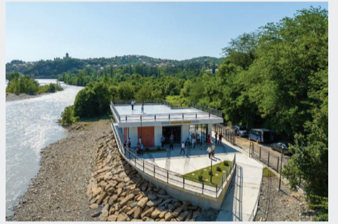
ლი პირებისთვის - ზვიად შალამბერიძე.

გამშვები ბაზიდან საჩვენებელი დასვება მოეწყო, რომელსაც იმერეთში სახელმწიფო რწმუნებულის ზვიად შალამბერიძე, რეგიონული განვითარებისა და ინფრასტრუქტურის მინისტრის მოადგილე მზია გიორგობიანი, ქუთაისის მერი იოსებ ხახალაიშვილი და ადგილობრივი ხელისუფლების წარმომადგენლები დაესწრნენ.