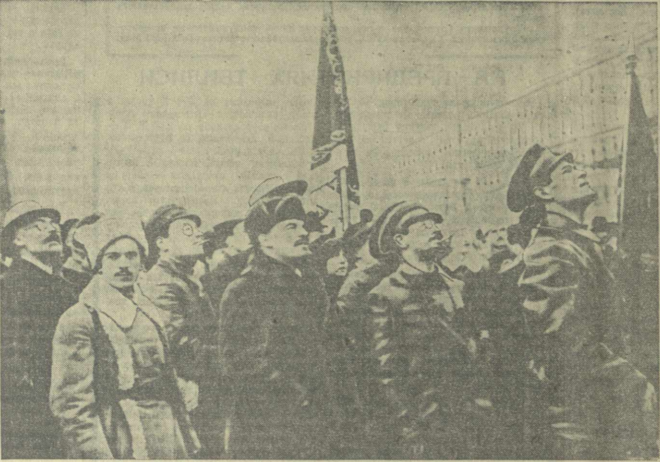
В. И. Ленин и Я. М. Свердлов на площади Революции в Москве 7 ноября 1918 года.