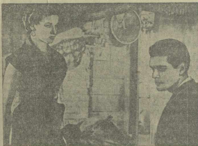
Кадр из египетского кинофильма «Борьба в долине». Амаль — артистка Фатин Хамама, Ахмад — артист Омар Аш-Шариф.

Ш. ЧАЛАГАНИДЗЕ, директор Курортного управления Цхалтубо.