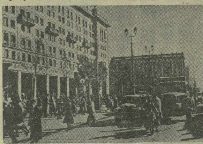
Варшава. На площади Конституции.