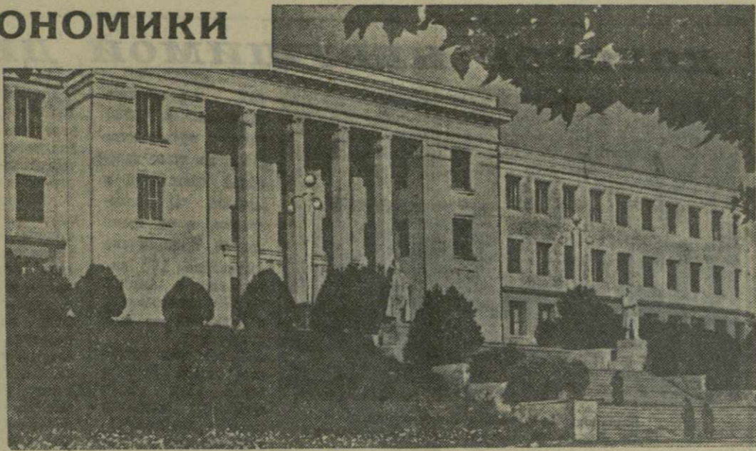
Сталинири. Дом Советов.

Решения XX съезда КПСС направлены на дальнейший расцвет всех братских республик и областей, экономики и культуры всех народов нашей страны. Воодушевленные решениями съезда, трудящиеся Юго-Осетинской автономной области не позволяют сил и энергии, чтобы с честью выполнять программу великих работ, предначертанную Коммунистической партией.