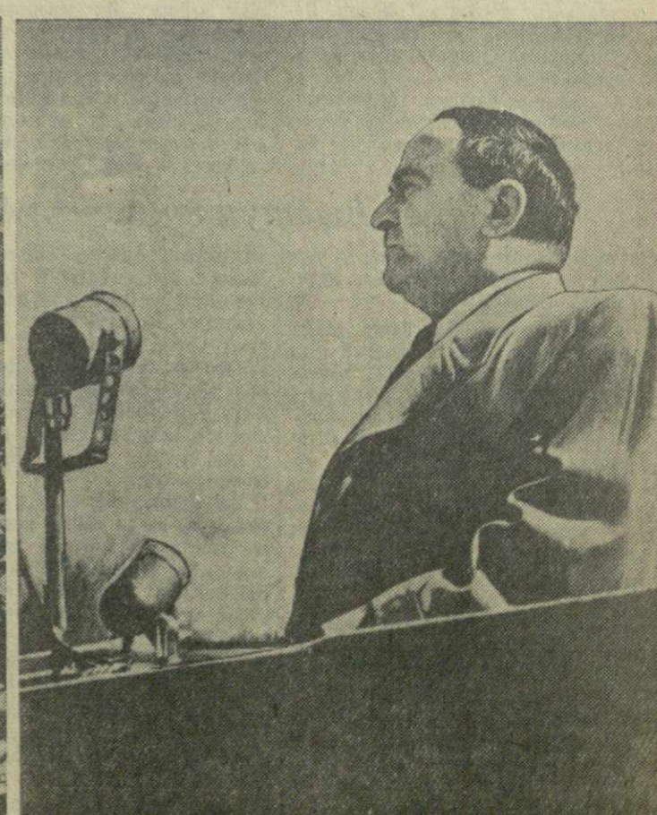
Вчера в столице нашей республики — Тбилиси на площади имени Ленина состоялся митинг представителей трудящихся города, посвященный открытию памятника основателю Коммунистической партии и Советского государства В. И. Ленину. На снимках: памятник В. И. ЛЕНИНУ. Внизу участники митинга. С речью выступает первый секретарь ЦК КП Грузии тов. В. П. Мжаванадзе. (Отчет о митинге см. на 3-й стр.)