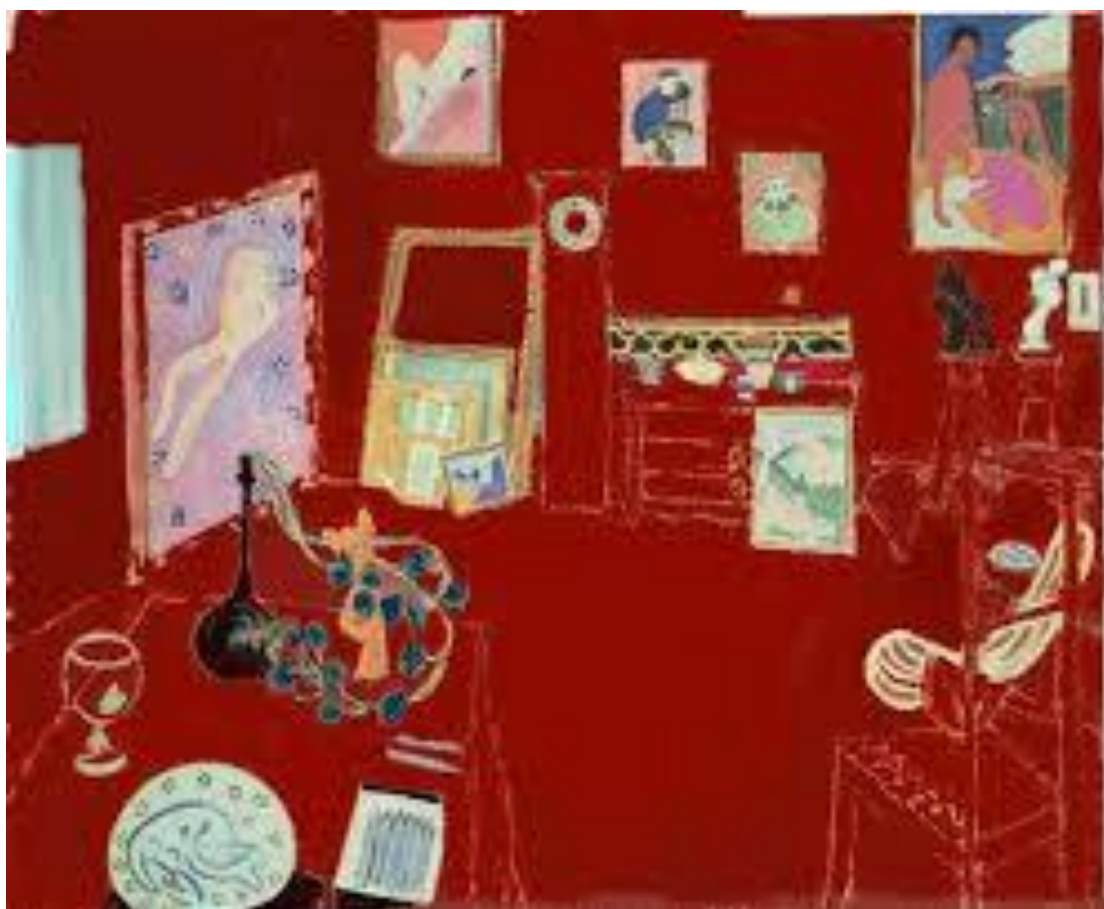
Henry Matisse, The Red Studio, 1911