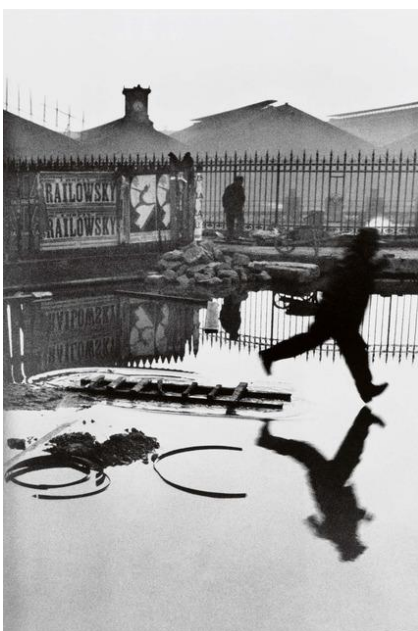
Henri Cartier-Bresson, A man jumps from a wooden ladder, 1932

მარტინ მუნკაცი, სამი ბიჭი ტანგანიკას ტბაზე, 1929