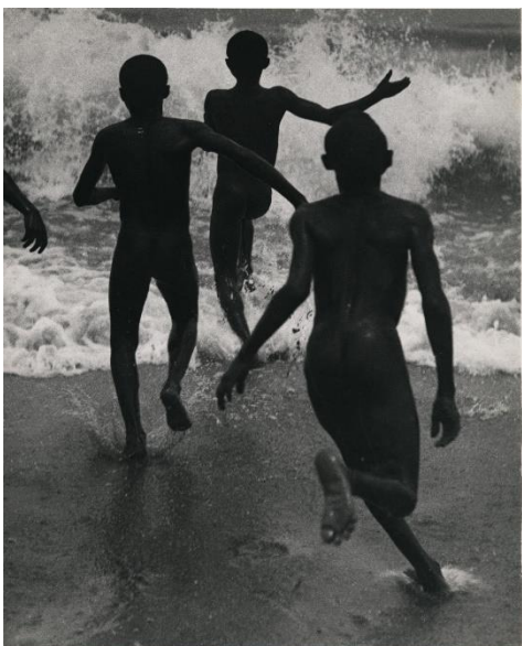
Martin Munkácsi, Three Boys at Lake Tanganyika, 1929

მარტინ მუნკაცი, სამი ბიჭი ტანგანიკას ტბაზე, 1929