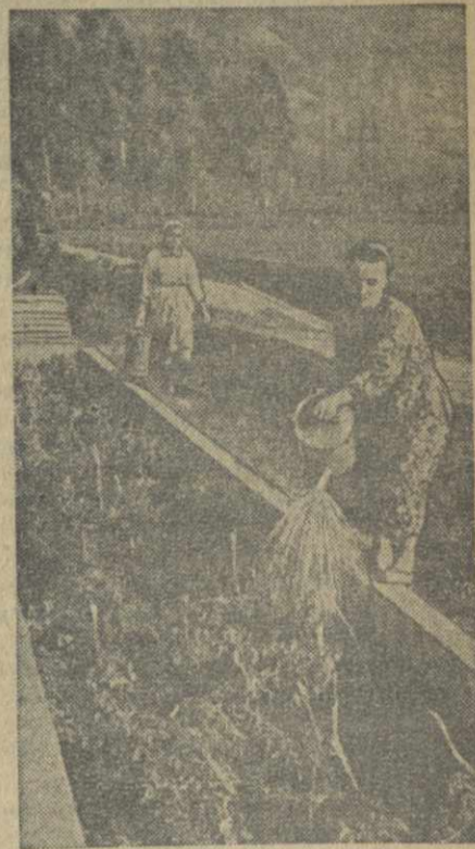
Колхоз имени Ленина Батумского района круглый год снабжает зеленью и овощами население г. Батуми. Скоро здесь получат ранние помидоры. На снимке: полка помидоров.