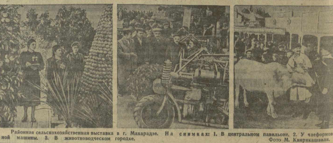
Районная сельскохозяйственная выставка в г. Махарадзе. На снимках: 1. В центральном павильоне. 2. У чаеформирующей машины. 3. В животноводческом городке.

колесный мотоцикл, чаеформирующей машины «ЧФ-1,6», которая вносит также удобрения и производит культивацию междурядий. На полях зоны МТС впервые в этом году работали кукурузоуборочный комбайн, машина «СШ-6» для квадратного гнездового сева кукурузы, фумигационная машина «ЧМ-12». И тем не менее процент механизации сельского хозяйства в районе, особенно в чайном хозяйстве, пока незначителен. Организаторы выставки сделали, несомненно, большое дело, показав успехи махарадзевских чаеводов, цитрусоводов, животноводов, полеводов, но, наряду с показом успехов, следовало шире и глубже осветить опыт передовиков. В павильоне колхоза имени Тельмана села Нагоблеви особенно внимание привлекают доставленные из открытого грунта огромные кусты помидоров, усеянные большими, налитыми соком, яркокрасными плодами. Этот сорт помидоров называется «Чудо рынка». И несмотря на темпозелые помидоры, выращенные в конце осени в открытом грунте, — явление действительно необыкновенное.