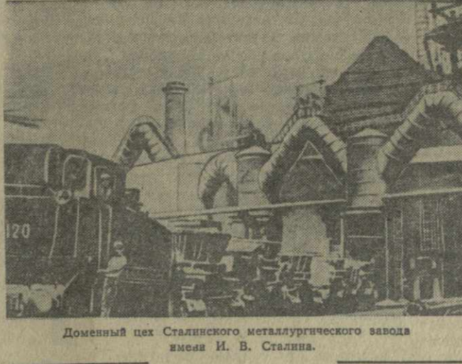
Доменный цех Сталинского металлургического завода имени И. В. Сталина.

13 мая с. г. «Заря Востока» опубликовала письмо коллектива Закавказского металлургического завода имени И. В. Сталина коллективу Сталинского металлургического завода имени И. В. Сталина в Донбассе.