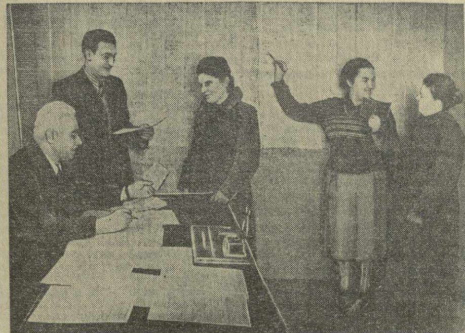
Избирательный пункт № 7 второго избирательного округа Сталинского района г. Тбилиси. На снимке: проверка списков избирателей.