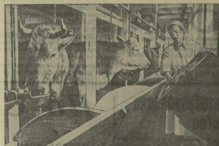
На механизированной молочно-товарной ферме села Асурети Тетрикарского района.