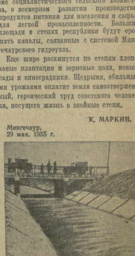
На трассе Верхне-Карабахского канала.