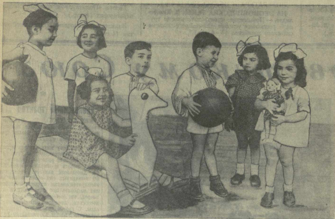
На снимке: воспитанники 69-го тбилисского детского сада Сталинского района.