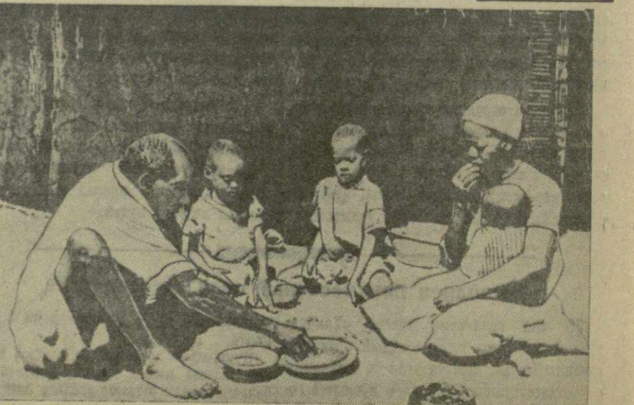
Тяжелый труд и скудное питание — таков удел африканских рабочих. И я снимке: семья африканского рабочего.

● Самая высокая детская смертность отмечается в Африке. Во многих районах Южной Африки она достигла 40 и даже 80 процентов.