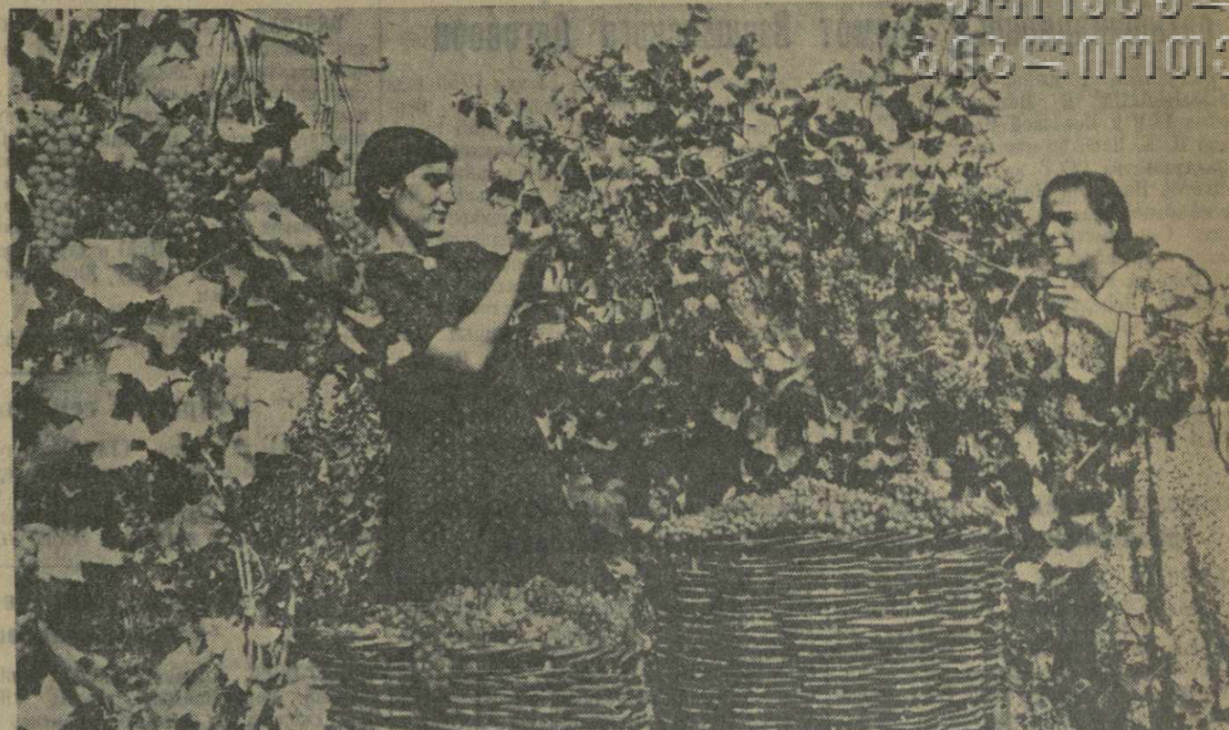
Сбор винограда в колхозе имени Калинина села Чумлаки Гурджаанского района. (Снимок сделан осенью 1954 года).

За этими цифрами — вложенный, творческий труд гурджаанских колхозников, которые, используя богатейший опыт, накопленный предшественниками колхозных виноградарей, умело сочетают его с достижениями советской науки и передовой практики. Гурджаанские виноградары