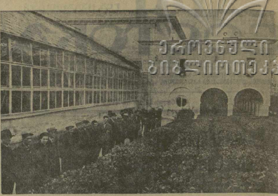
Всесоюзная сельскохозяйственная выставка. На снимке: группа экскурсантов осматривает чайные кусты у павильона Грузинской ССР.

председатель Ткварчельского райкома профсоюза рабочих угольной промышленности.