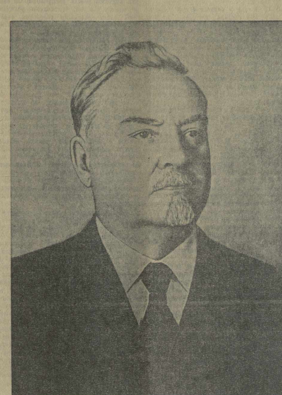
Товарищу БУЛГАНИНУ Николаю Александровичу

Вырастить высокие урожаи кукурузы на всех площадях — дело большой государственной важности. Долг руководителей партийных, советских и хозяйственных органов, специалистов сельского хозяйства — мобилизовать и умело использовать все силы и средства для выполнения этой ответственной задачи.