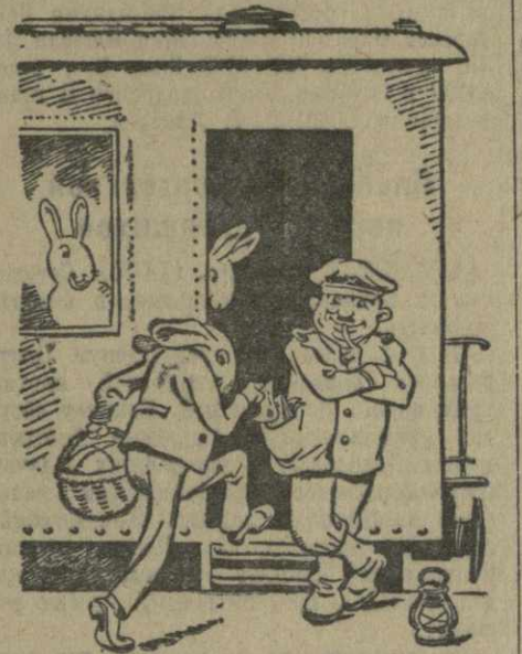
Рис. И. Гурро.

Не лучше обстоит дело и с доставкой билетов на дом. На таких станциях, как Тбилиси, Баку, Ереван и Сухуми, прием заказов на билеты организован по кустарно-из-за отсутствия специальных помещений или вовсе не организован. Заказчик зачастую не может дозвониться в стол заказов, так как телефоны повсюду параллельные. А если учесть и то, что штат