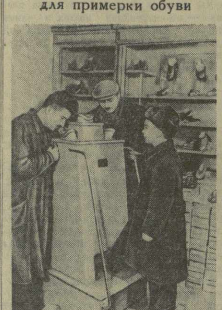
Аппарат для примерки обуви