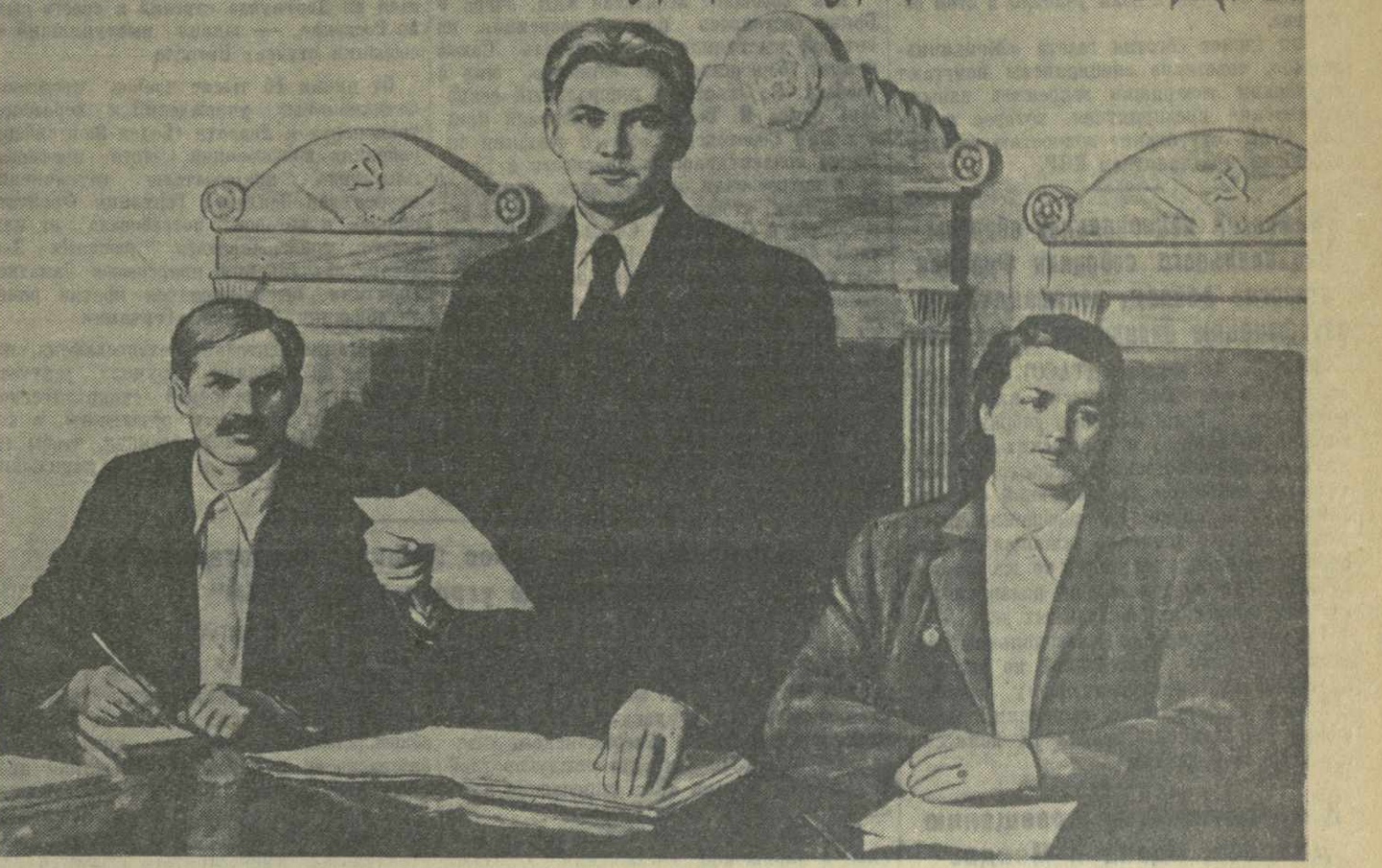
Плакат художника Б. Белопольского, выпущенный Государственным издательством изобразительного искусства.