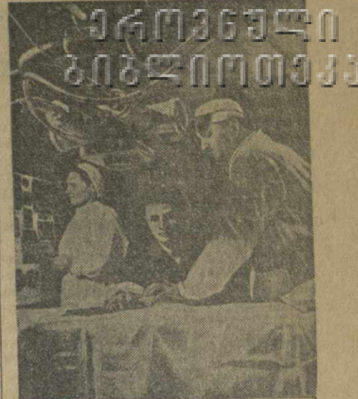
Лянчухи. На снимке: в рентгеновском кабинете городской больницы.