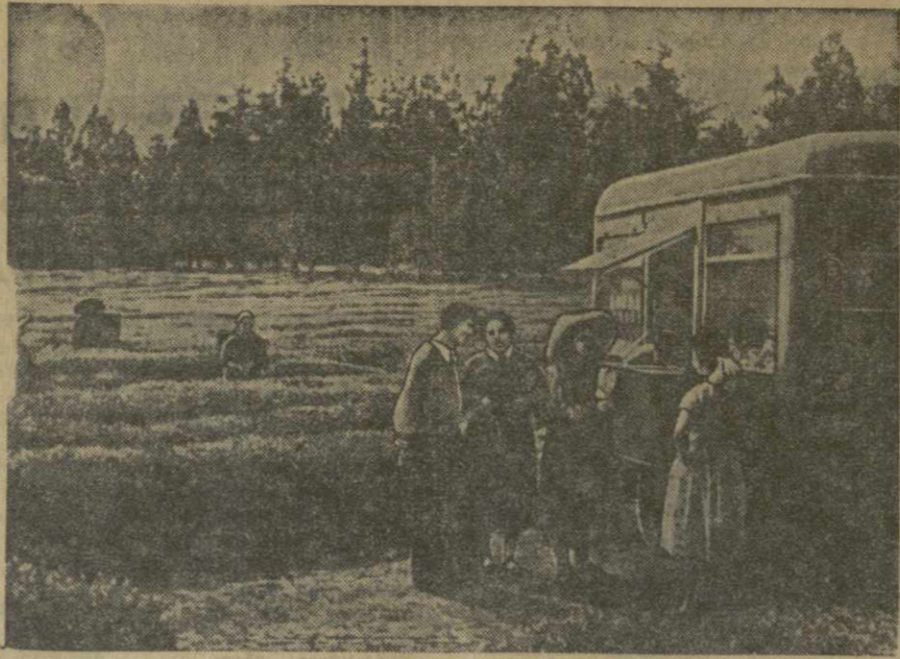
На снимке: автолавка на чайных плантациях колхоза имени В. И. Ленина села Натанеби Махарадзевского района.

А. БЛРЦАН, секретарь Ахалкалакского РК КП Грузии.