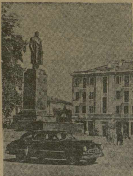
Город Махарадзе. Площадь имени И. В. Сталина.