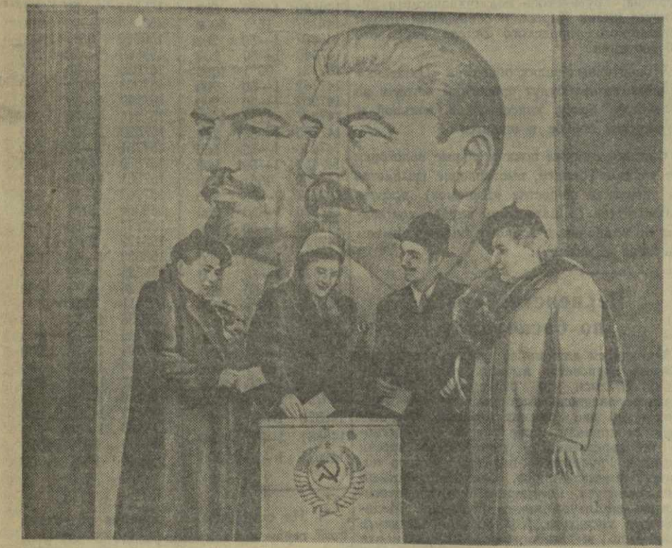
Голосование на избирательном пункте № 5 района имени Сталина в Тбилиси.

К нотам Советского Правительства правительствам указанных выше стран приложен текст Декларации Правительства СССР, Польской Народной Республики, Чехословацкой Республики, Германской Демократической Республики, Венгерской Народной Республики, Румынской Народной Республики и Народной Республики Болгарии, принятой на Московском Совещании европейских стран по обеспечению мира и безопасности в Европе 2 декабря 1954 года и поддержанной Правительством Китайской Народной Республики.