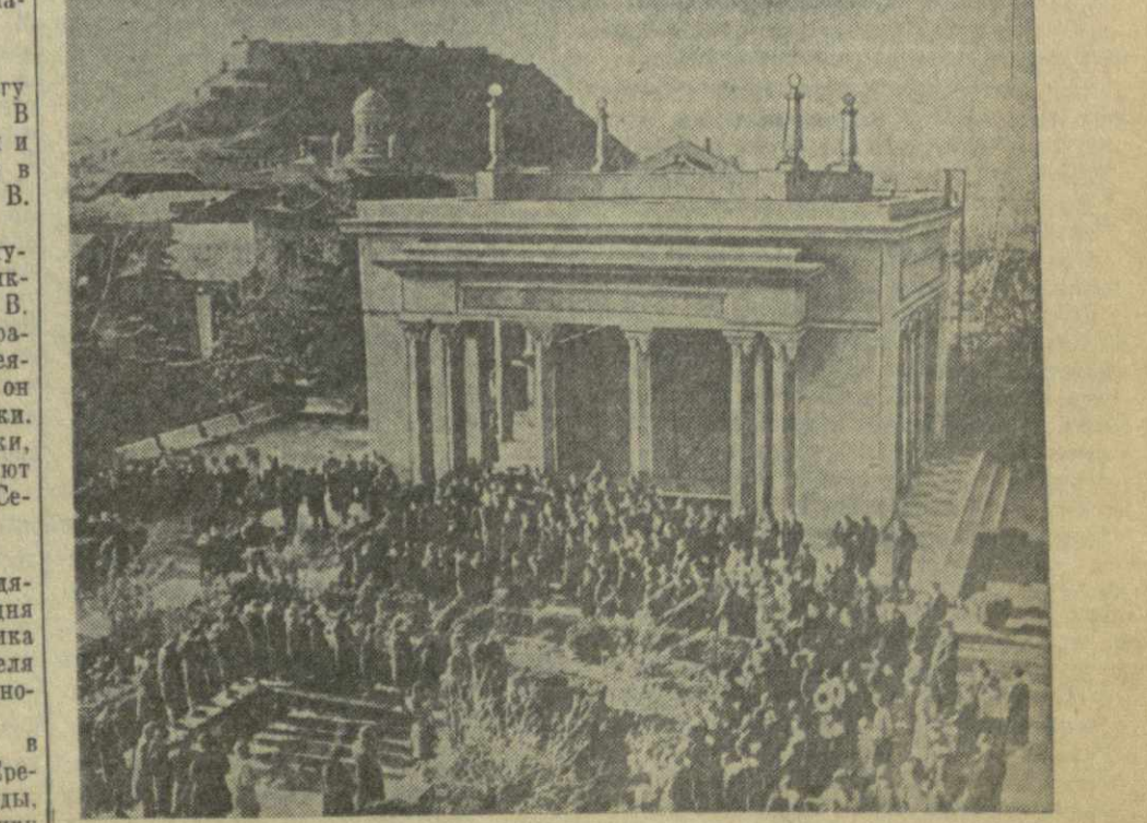
Со всех концов Советского Союза приезжают трудящиеся в Гори, к домику, где родился и провел детские годы И. В. Сталин. На снимке: экскурсанты у исторического домика.

Свыше 300 агитаторов Тбилисского Государственного университета имени Сталина провели беседы среди студентов и населения, посвященные 75-летию со дня рождения И. В. Сталина. 22 декабря в актовом зале собирается научная сессия Государственного университета имени Сталина, посвященная этому знаменательному дню. Большая выставка литературы и фотодокументов, посвященная И. В. Сталину, открылась в Государственной публичной библиотеке имени Карла Маркса. Выставки литературы, посвященные 75-летию со дня рождения великого сына партии и народа И. В. Сталина, открылись также в Окружном Доме офицеров, в Государственной научной библиотеке имени Джарулидзе, в массовых библиотеках имени Сталина, имени Крупской, имени Шаумяна и в ряде других культурно-просветительных учреждений Тбилиси.