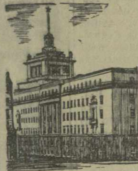
София. Новое здание Совета Министров.

МЕНЯ командировали в Народную Республику Болгарию на Международную Ярмарку в Софии.