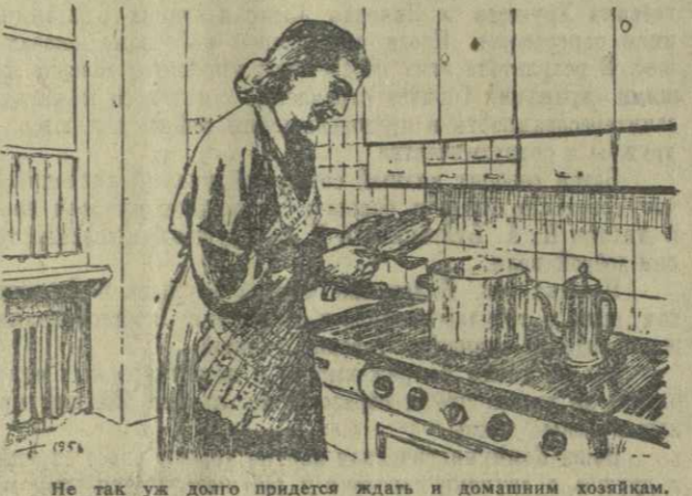
Не так уж долго придется ждать и домашним хозяйкам. В шестой пятилетке начато строительство газопровода Грозный—Тбилиси. Вероятно, многие домашние хозяйки уже представляют себя у газовой плиты.