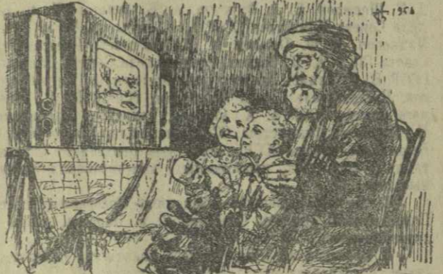
Многие тбилисцы уже покупают телевизоры. И не зря. В этот год в Тбилиси будет построен телецентр, и жители города на его окраинах смогут смотреть телевизионные передачи. Недалек тот день, когда у телевизора, как изображено на нашем рисунке, будет сидеть бабушка с внуками.