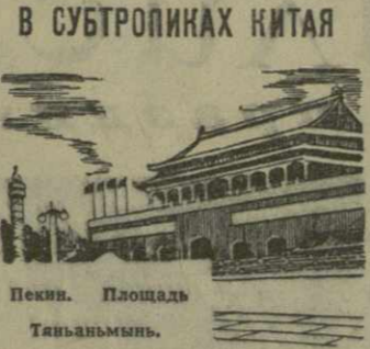
Пекин. Площадь Тяньаньмэнь.