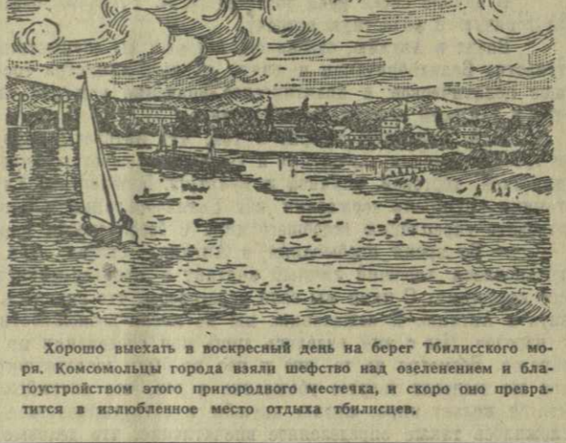
Хорошо выехать в воскресный день на берег Тбилисского моря. Комсомольцы города взяли шефство над озеленением и благоустройством этого природного местечка, и скоро оно превратится в излюбленное место отдыха тбилисцев.