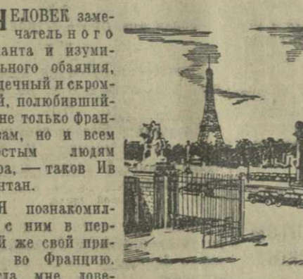
Париж. Площадь Конкорд.

ЧЕЛОВЕК замечательного таланта и удивительного обаяния, сердечный и скромный, полюбившийся не только французам, но и всем простым людям мира, — таков Ив Монтан.