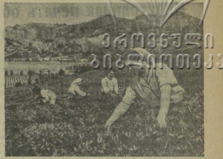
В Аджарии началась выборочная сбор чайного листа. Первым приступил к сбору Салибаурский чайный совхоз имени Сталина.