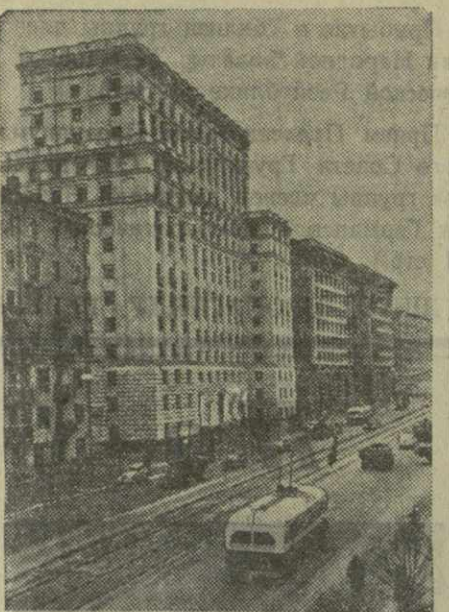
Москва сегодня. На Краснопрудной улице.