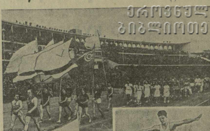
ФЛАГИ НАД КОЛОННАМИ

В минувшее воскресенье на стадионах, спортивных площадках, кортах, стрельбищах, в гимнастических залах Тбилиси состоялся соревнования участников тбилисской городской спартакиады. Соревнования привлекали десятки тысяч зрителей. В них участвовали коллективы физкультурников многих предприятий, учреждений и учебных заведений столицы Советской Грузии.