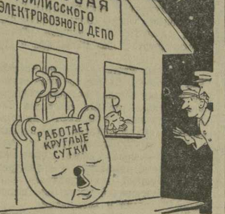
Комментарии наизусть.