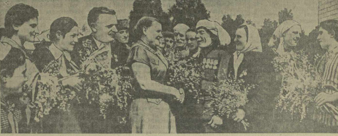
Колхозники Генического района Украинской ССР в гостях у колхозников сельхозартели имени Буденного села Ганахлаба Махарадзевского района.