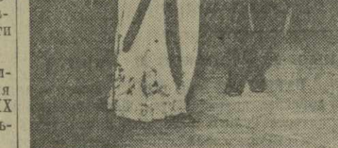
Выступление коллектива художественной самодеятельности Генического района УССР в Махарадзевском государственном театре.

Н. ЯРОВ, Ч. ХОМЕРИКИ. (Спец. корр. «Зари Востока»).