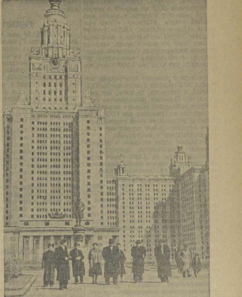
Знакомясь со столицей нашей Родины — Москвой, делегация тбилисских педагогов и школьников побывала в Московском государственном университете на Ленинских горах.

Следует отметить, что педагогический коллектив 204-й школы критически относится к своей работе и обобщает все то новое, с чем ему удается познакомиться в процессе политехнического обучения.