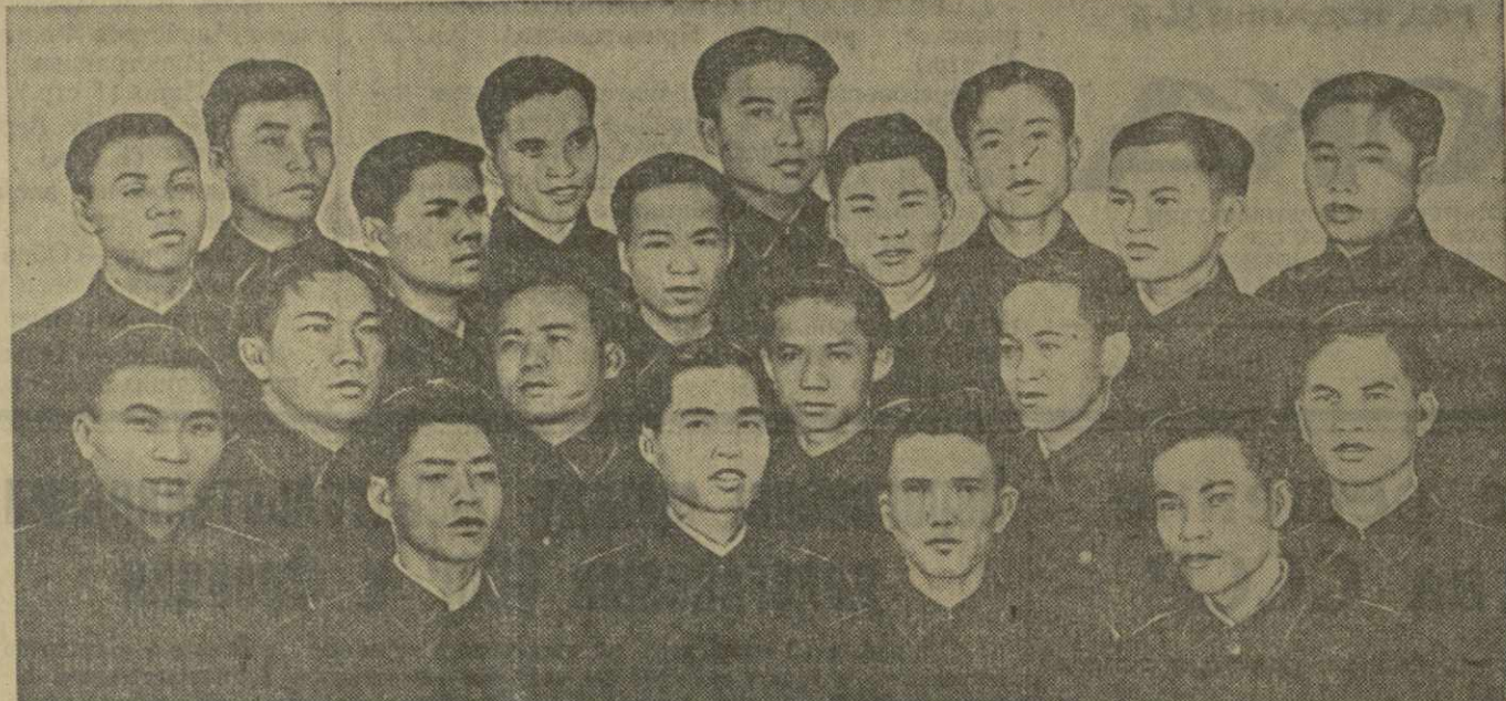
В Махарадзе находятся молодые специалисты чайной промышленности Демократической Республики Вьетнам. Они учатся в Махарадзевском технологическом техникуме. Дружбы из далекого Вьетнама окружены отеческой заботой и вниманием. Вьетнамские студенты будут изучать технологию чайного производства, оборудование предприятий чайной промышленности, основы организации производства и ряд других предметов. Производственная практика их организуется на Махарадзевской чайной фабрике. На снимке: группа молодых вьетнамцев, изучающих технологию чайного производства в Махарадзе.

На всех предприятиях города с большим подъемом проходит подписка на новый государственный заем.