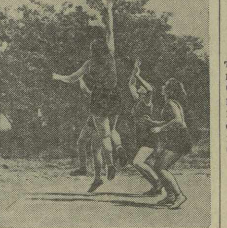
На Тбилисском предшкольно-тренировочном комбинате лютят спорт. В обеденный перерыв и после работы на спортивных площадках предприятия всегда можно видеть многих производственников. На снимке: тренируются баскетболисты.

Укомплектована сборная команда Аджарской АССР, которая примет участие в спартакиаде Грузинской ССР.