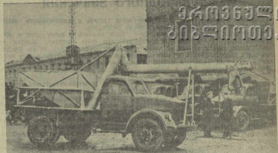
ключается в том, что он не только ссыпает зерно, но и формирует его в бунты на току.