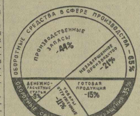
СТРУКТУРА ОБОРОТНЫХ СРЕДСТВ КРУПНОЙ ПРОМЫШЛЕННОСТИ ГРУЗИНСКОЙ ССР

менклатура изделий на машиностроительных заводах, в частности на Кутаисском заводе «Горняк», и др. Однако до настоящего времени эта работа практически все еще не развернута в тех масштабах, которые отвечали бы решениям XX съезда КПСС.