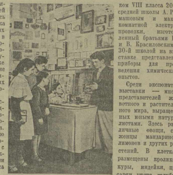
Представленные на выставке красивые вышивки, корзиночки и поделки из дерева, вылепленные из пластилина герои любимых сказок — работы учащихся младших классов. Л. ПОПХАДЗЕ. На снимке: один из уголков выставки.

В разряде физических приборов внимание привлекает генератор ультравысокочастоты, изготовленный учени-