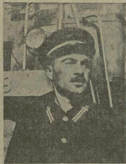
деметров вожу поезд без применения авто- тормозов, направляя в контактную сеть энергию, вырабатываемую тяговыми двигателями.

Интересно, что применение рекуперативно-реостатного торможения дает тем больше эффекта, чем тяжелее поезд.