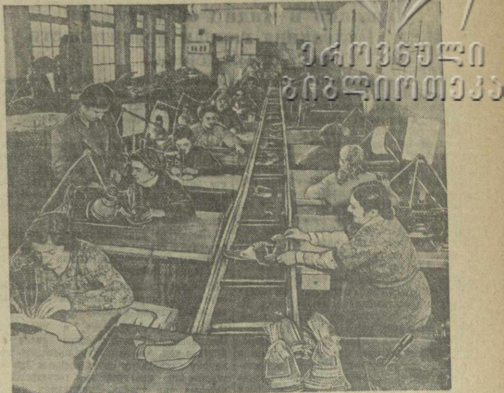
Кутаисский кожаный комбинат. На снимке: швейный конвейер в цехе заготовок.