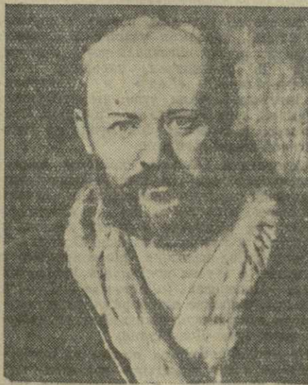
Гольдони и Гоцци, Маккиавелли и индийского драматурга Паршурاما.

(К 70-ЛЕТИЮ СО ДНЯ СМЕРТИ А. Н. ОСТРОВСКОГО)