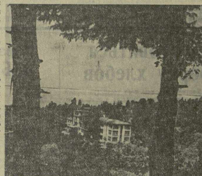
Батуми. На снимке: санаторий ВЦСПС на Зеленом Мысу.

На днях редакция газеты «Заря Востока» совместно с Абхазским и Аджарским областными и Сухумским и Батумским городскими комитетами партии провела в гг. Сухуми и Батуми совещания своих рабочих и сельских корреспондентов. На совещаниях были обсуждены задачи печати в свете исторических решений XX съезда КПСС и роль рабочих и сельских корреспондентов в осуществлении этих задач.