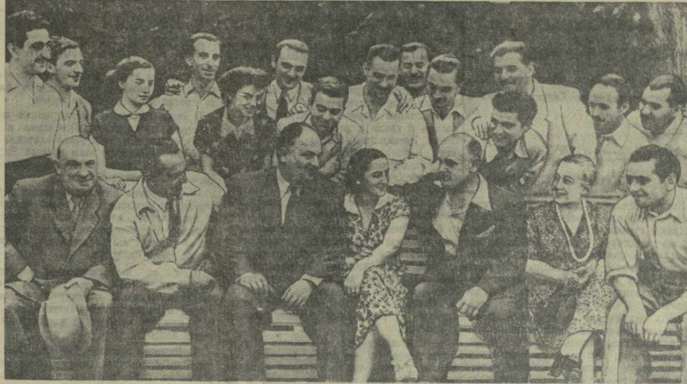
На снимке: группа артистов Грузинской государственной филармонии.

Особый интерес для Грузии представляют также нефтяные месторождения. В