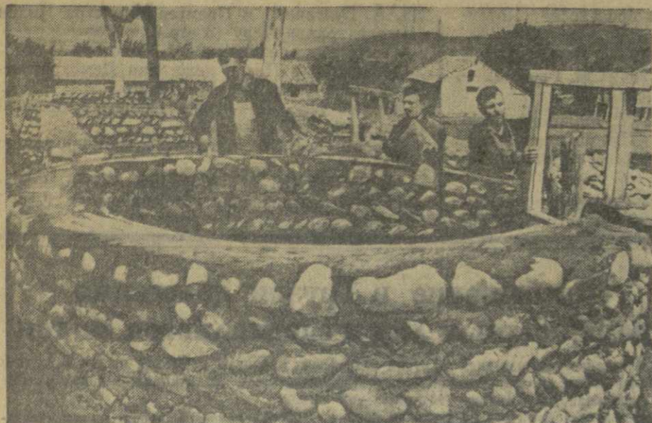
На снимках: строительство силосных сооружений в колхозах имени Сталина села Галавани и имени Хрущева села Цилкани Мухранского района.