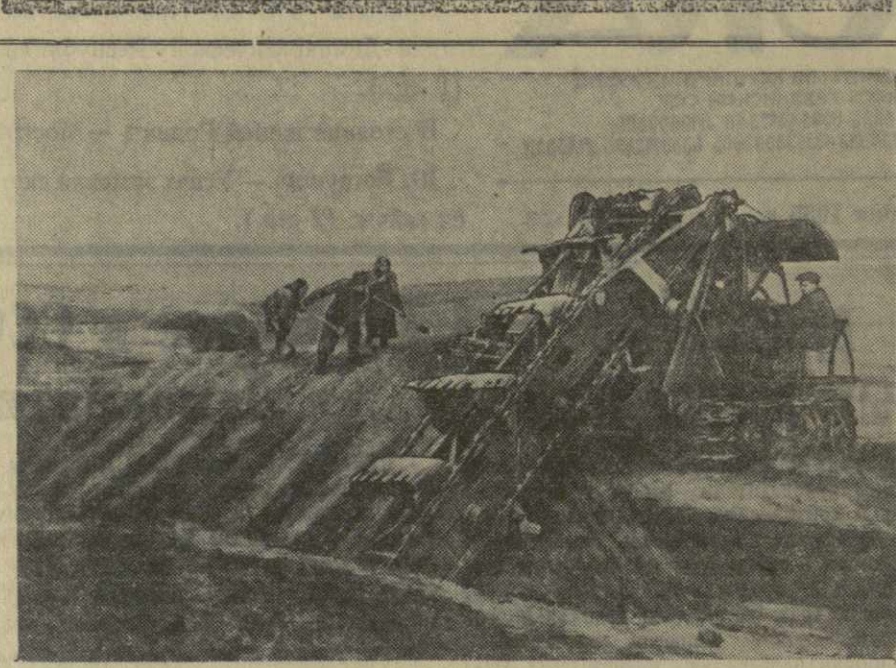
В колхозах Львовской области широко ведется строительство силосных сооружений. Механизаторы Неслуховской МТС на сооружении силосных траншей применяют многофункциональный экскаватор. На снимке: рытье силосных траншей в колхозе имени Молотова Ново-Милытинского района.