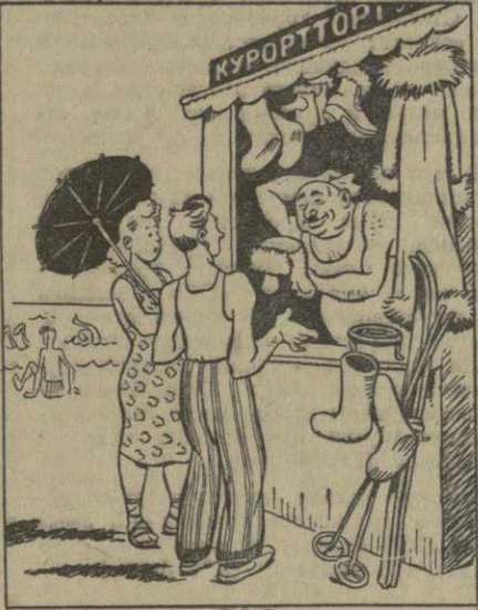
Рис. И. ГУРРО.

В кафе-закусочных №№ 2 и 14, расположенных в центре Сухуми, потребителю редко может получить чай, кофе, за-