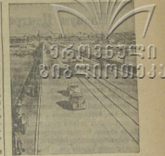
Новосибирск. Открылось движение по Новосибирскому городскому мосту через Обь. Общая длина мостового перехода превышает 2,5 километра. На снимке: общий вид нового моста через Обь.

Г. ЧАНУКВАДЗЕ, кандидат экономических наук.