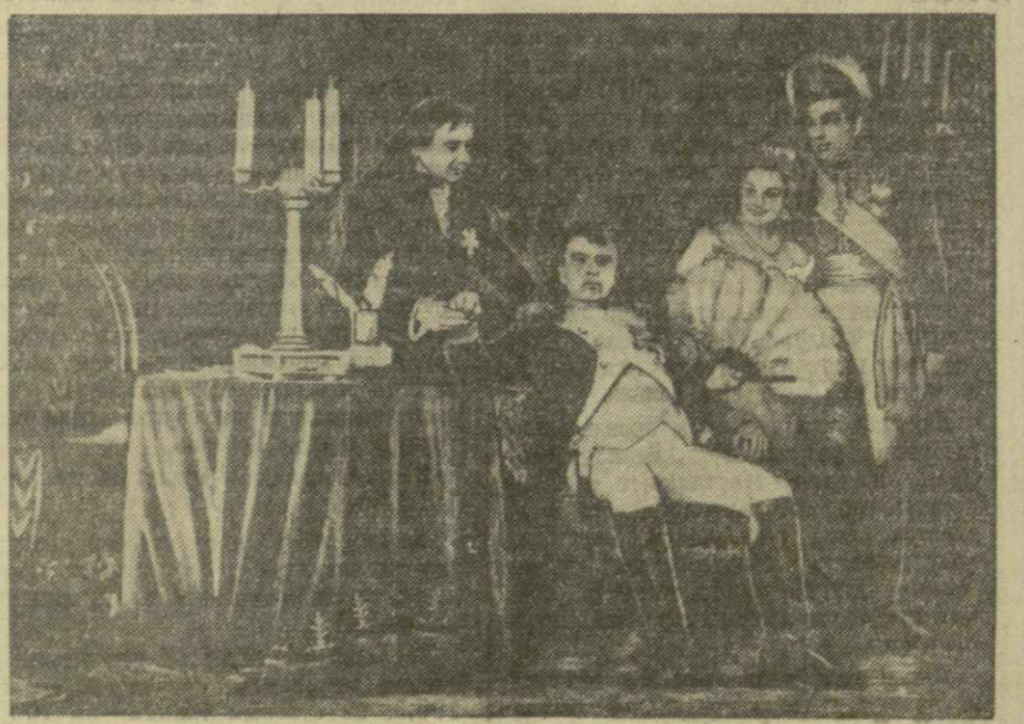
На снимке: сцена из спектакля «Катрин Лефевр».

Наполеон — Оленин, великолепный актер, созданный целый ряд высокохудожественных сценических образов.