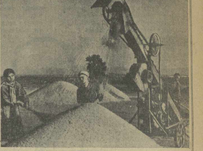
серьезным источником получения дополнительных запасов зерна и кормов.

Каждое лето имеет свои особенности, свои приметы. Нынешнее лето пришлось необычайно поздно — после затянувшейся холодной весны сразу наступили горячие, жаркие дни.